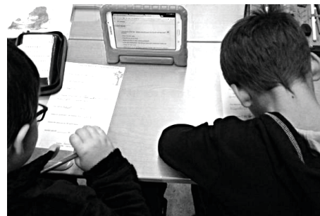
Grainauer Schüler bei der Recherche im Internet

Die 3. Klasse der Grundschule Grainau setzt seit diesem Schuljahr Tablets und das Internet als Lernmedium ein. Das Lernziel ist, Medienkompetenz zu erwerben und den verantwortungsvollen Umgang mit dem Internet zu erlernen. Die Geräte werden in den Unterrichtsfächern Deutsch und Mathematik bei Übungsmöglichkeiten eingesetzt. Hier wird das Recherchieren in Kinder-