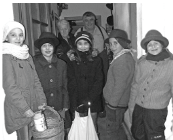
Kinder der Grundschule Grainau beim „Anklöpfeln“

Wir freuen uns, dass in unserem Dorf das alte Brauchtum noch gelebt wird und wünschen allen „Anklöpfelern“ viel Spaß und Freude am Singen.