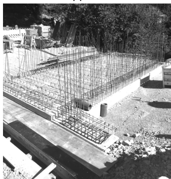
Brücke in der Alpspitzstraße

Die Gemeinde bedankt sich nochmals herzlich bei allen Anliegern für das Verständnis und die Geduld während der Bauarbeiten innerhalb des letzten Jahres und ist sich sicher, baldmöglichst eine einwandfreie Alpspitzstraße dem Verkehr übergeben zu können.