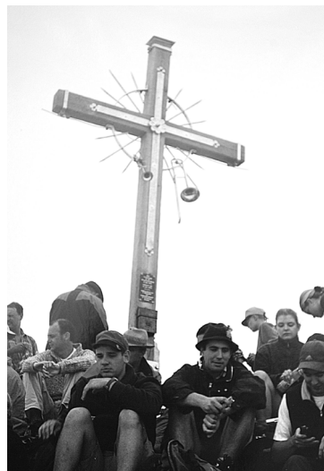
Grainauer bei der Kreuzaufstellung 2003 am Waxenstein