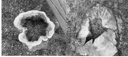
Das „Innenleben“ der beiden gefällten Bäume am Oberen Dorfplatz

Einheit die optisch wahrnehmbar den Fahrverkehr entschleunigt. Die Pflasterung wird im Bereich der Gehwege fortgeführt. Ergänzt durch ein dem Naturstein angepassten Fahrbahnbelag