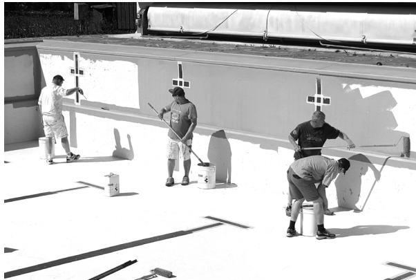
Schwimmbadmitarbeiter bei den Renovierungsarbeiten im großen Schwimmbecken

unbeschwertes Schwimmvergnügen erleben. Wie jedes Jahr im Frühjahr wurden auch heuer wieder in allen Freibadbecken die Schäden an den Wänden und am Beckenrand beseitigt und erhielten einen neuen blauen Anstrich. Weitere Reparaturmaßnahmen im Innenbereich des Bades sowie eine komplette Grundreinigung in allen Innen- und Außenbereichen des Bades wurden durchgeführt.