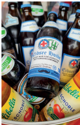
Die Wasserwacht Grainau bietet heuer wieder ihre beliebte „Eibsee Hoibe“ und natürlich auch ihre Cocktails an